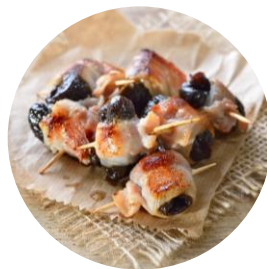
Pruneau roulé Au lard