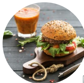
Mini burger au canard