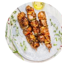
Brochettes de Poulet au Thym