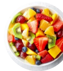
Salade de Fruits