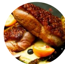
Magret de Canard